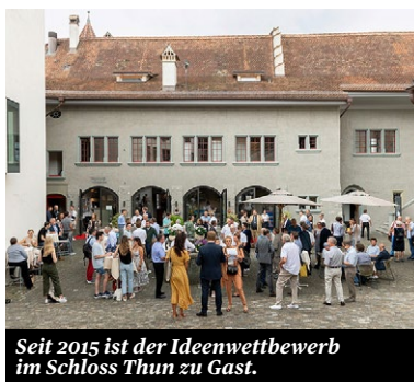
Seit 2015 ist der Ideenwettbewerb im Schloss Thun zu Gast.